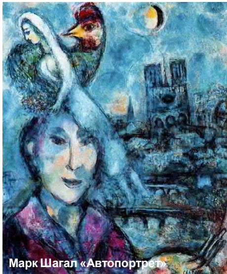
Марк Шагал «Автопортрет»

Многие из присутствующих с восхищением отмечали, как тонко и трепетно фильм передал не только основные вехи